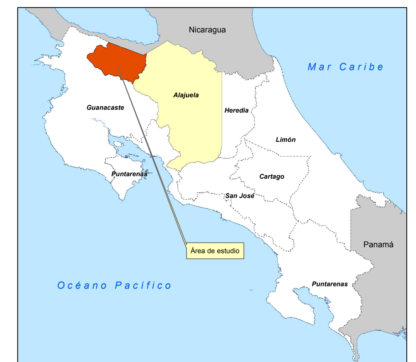
MATRIZ DE INFORMACIÓN DE VALORES DE TERRENOS POR ZONAS HOMOGÉNEAS PROVINCIA 2 ALAJUELA CANTÓN 13 UPALA DISTRITO 08 CANALETE